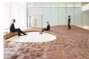
豊洲キュービックガーデン

開催時間/17:00~ 申込締切/2011年12月1日(木) ※多数お申し込みの場合には先着順とさせていただきます。