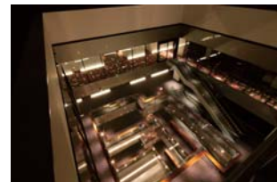
日本ビュレット・ビックカード本社ビル