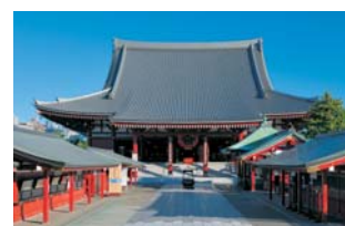
浅草寺本堂 (外部改修)