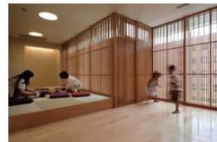
聖路加産科クリニック