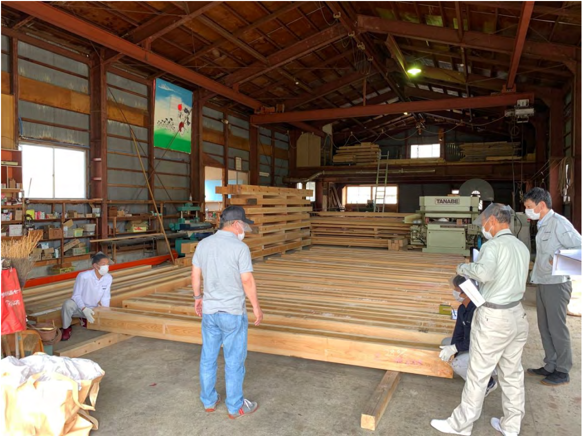
桜御門で使用予定の木材（マツ・ケヤキ）の検査を行いました。