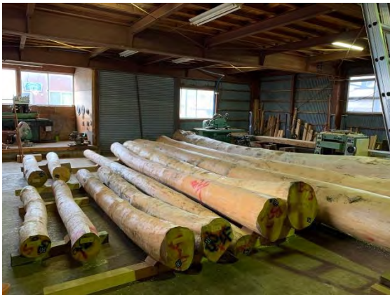
小屋梁等の丸太材です。（マツ）