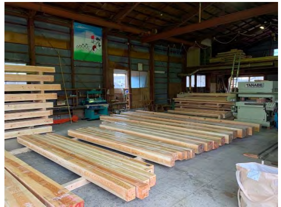
柱・土台等の角材化粧材です。（マツ）