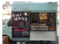
ニュージーランド社