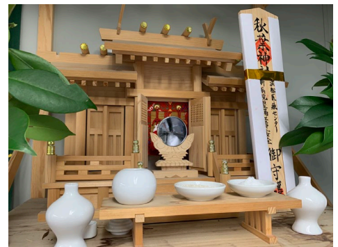
関係者で安全祈願に行きました(秋葉神社)

また、竣工に向け安全祈願に行ってきました。浜松医療センター新病院の竣工へ向け、みんなでベクトル合わせて進んでいきます。