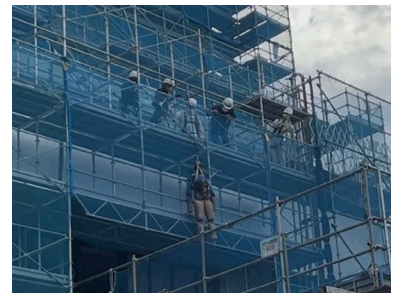
墜落デモンストレーション

本現場の取り組みとしては、浜松医療センターの保健師様にご講和をいただき現場関係者一人一人の健康目標を設定したり、安全帯をかけた状態で墜落するとどのような衝撃が人体に加わるのかを自分達で確かめるべく、人形を用いた墜落デモンストレーションの実施を行いました。取り組みを経て、各々がより一層健康・安全意識を高めることができました。