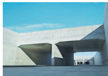
圏央道桶川北本地区函渠その2工事

圏央道の鶴ヶ島JCT(関越道)と久喜白岡JCT(東北道)間の一部に箱型函渠を施工しました。