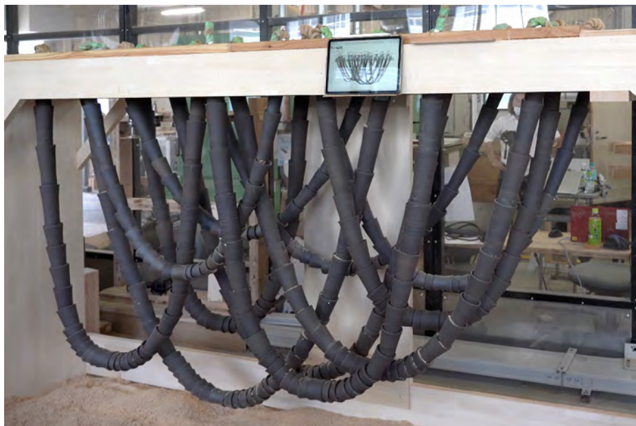
一見ランダムに見える陶製のれん。実際には複雑なアルゴリズムで人とロボットがフィードバックを繰り返すことで作られています。ひとつひとつの陶器は常滑市の陶芸家が製作。 © T_ADS Obuchi Lab

やきもの工場に囲まれた中庭に続くエントランスに設置される、木製の柱と梁で構成された門のような構造物。通り側と中庭側の梁には、数多くのネックレスのような陶器が吊るされ、昔ながらの暖簾(のれん)を想像させます。この陶製のれんは、来場者を迎え入れるとともに、温度調節を行う環境装置にも。梁に設置したミストノズルから陶器へ噴射した水分が気化する際、ミストと陶器の蒸散冷却効果によって、門の周囲は4 -5°C涼しくなると見込まれます。