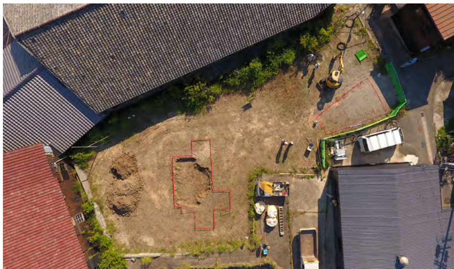
やきもの工場に囲まれた会場。2022年7月初旬・施工前の撮影

人々の身体的個性をデザインに反映させるため、体格も体力も様々な子供と大人に、1本のネックレス状の陶器を持ってもらい、それをスキャンしてデータ化しました。そうすることにより、各々の身体的個性に応じた様々なサイズや形状のネックレスがデザインに加わります。その様々なネックレスは、コンピュータによって構造的に最適な設置場所が計算され、それを受けてロボットが梁に穴を開け、人の手によって1本ずつ吊り下げられていきます。