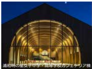
浦和明の星女子中学・高等学校カプテリア棟