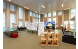
2023年10月に本社にて開催した時の様子

よりよい建物を目指して常に進化し続ける最先端技術を動画・パネル・実物で紹介します。