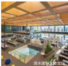
清水建設北陸支店

会場：清水建設 温故創新の森 NOVARE Hub 棟 1階エントランス（土日祝日休館）