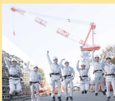
エスシー・マシーナリ