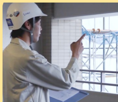
シミズ・ビルライフケア