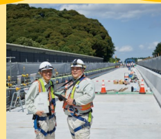
日本ファブテック