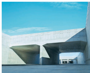
圏央道桶川北本地区区函渠その2工事

※の区間の開通時期については土地収用法に基づく手続きによる用地取得等が速やかに完了する場合